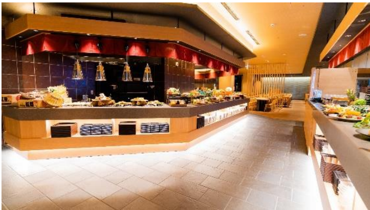
【写真:2F ブッフェレストラン「月舟」】