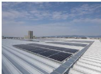
<太陽光パネル 屋上>