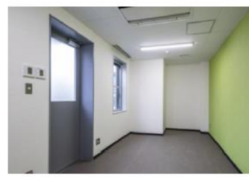
<ドライバー用休憩室>