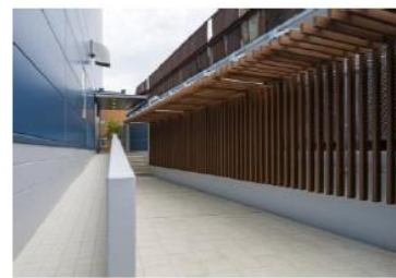
<エントランスアプローチ>