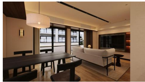
※301号室リノベーション前→完成予定イメージ